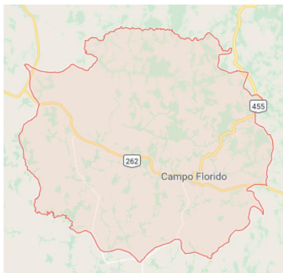
Figura 01 - Localização da cidade de Campo Florido dentro do Estado de Minas Gerais

“Atualmente apresenta uma população de 6.870 habitantes dentro de uma área territorial de 1.264,245 km 2 sua localização pode ser vista na figura 01. A cidade de Campo Florido possui uma taxa de escolarização de 98,8% entre a faixa etária de 6 a 14 anos de idade, dispendo de 05 escolas de ensino fundamental e 01 escola de ensino médio. Os seus moradores possuem uma renda média mensal nos empregos formais de 2,9 salários mínimos, apresentando um índice de desenvolvimento humano municipal (IDHM) de 0,706 (IBGE, 2010a apud VALLIM, 2018)”. “Segundo os dados do IBGE levantados através do censo, existem um total de 1.584 pessoas que apresentam algum tipo de deficiência (auditiva, mental, motora ou visual). Nesse levantamento, foi observado que 11 pessoas com deficiência auditiva não conseguem ouvir de modo algum. Com deficiência mental existem 76 pessoas, já a deficiência motora 26 indivíduos e 08 pessoas que não enxergam (IBGE, 2010b apud VALLIM, 2018)”