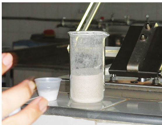
Figura 6: Adição de pectina e glicose

o ácido para formar o gel. O processo de concentração deve variar entre 8 a 12 minutos, até que se atinja a faixa de 64 a 71°Brix. Durante a cocção são destruídos os microrganismos patogênicos e as enzimas proteolíticas presentes, propiciando melhores condições de conservação ao produto (LICODIEDOFF, 2008).