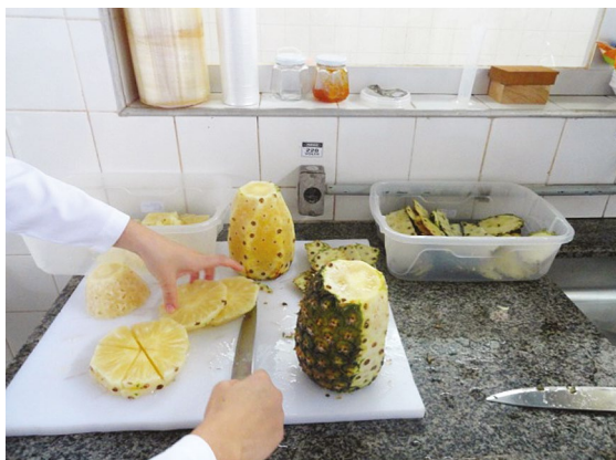
Figura 3: Descascamento

O descascamento foi realizado manualmente (Figura 3) utilizando uma faca de aço inox, para retirada de partes injuriadas e em seguida os frutos foram picados manualmente no formato de cubos de aproximadamente três cm. (Figura 4).