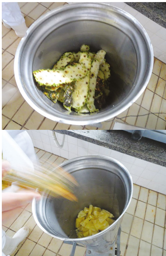
Figura 5: Trituração de frutos e casca

Na sequência, a polpa e a casca foram trituradas em liquidificador industrial em alta rotação até completa homogeneização (Figura 5).