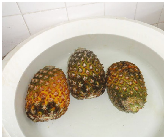
Figura 2: Sanitização dos frutos

Na etapa de seleção, frutos muito verdes, amassados ou que apresentaram alguma injúria, foram descartados. Em seguida, lavados em água corrente para a retirada de sujidades advindas do cultivo, colheita e transporte, para então serem sanitizados através da imersão em solução clorada e a 100 ppm durante 10 minutos (Figura 2).