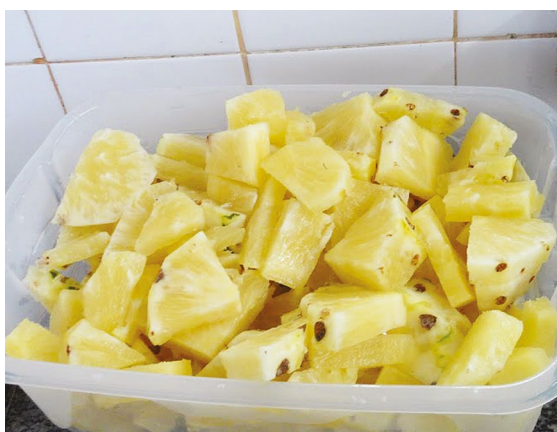
Figura 4: Frutos picados