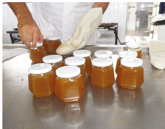
Figura 7: Envase

aquece a embalagem. Além disso, o envase nesta temperatura tem por finalidade assegurar uma geleificação adequada, uma distribuição homogênea de frutos, uma padronização de peso nas embalagens, redução dos riscos de quebra dos vidros devido ao choque térmico e diminuição das alterações de cor e sabor. (LOPES, 2006)