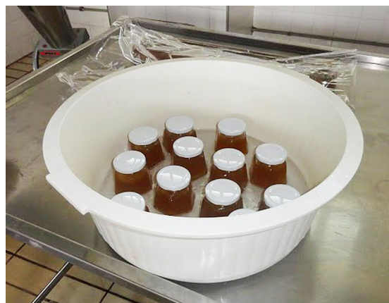
Figura 8: Envase

Deixou-se espaço de aproximadamente um centímetro entre geleia e tampa a fim de que houvesse a formação de vácuo no produto. Após envase os produtos ficaram imersos em água a fim de concluir o resfriamento e em seguida acondicionados em prateleira (Figura 8). As geleias devem ser resfriadas logo em seguida, porém não com excessiva rapidez. Caso permaneçam quentes por muitas horas podem apresentar alterações de sabor.